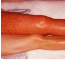
Imagen de una trombosis venosa severa en la pierna izquierda de este paciente.

No todas las TVPs causan síntomas perceptibles, pero los más comunes son el edema y enrojecimiento de la pierna afectada, frecuentemente asociada con algún grado de dolor en la misma zona. Dolor torácico severo o dificultad para respirar podrían indicar una tromboembolia pulmonar (TEP) y esta condición debe de ser evaluada en un centro hospitalario inmediatamente.